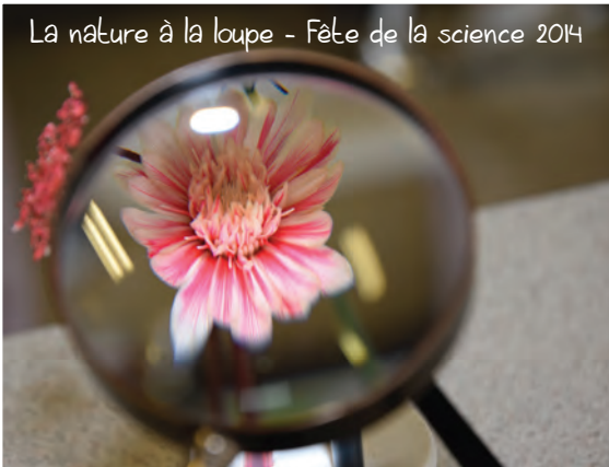
La nature à la loupe - Fête de la science 2014