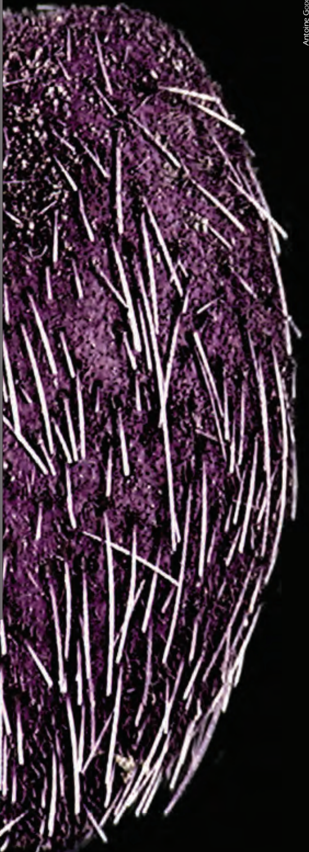
Oursin irrégulier des grandes profondeurs du genre Pourtalesia . Il a des piquants très fins et une forme de petite bouteille.

Cette diversité et cette abondance des oursins se retrouvent également dans les couches fossiles. Au tout début de leur histoire (vers 440 millions d'années), les oursins étaient tous réguliers et ils le sont restés très, très longtemps. Vers 250 millions d'années survient la plus grave crise que la biodiversité ait connue : plus de 90% des espèces marines disparaissent et seule une petite poignée d'espèces d'oursins survivent. Après la crise, ils retrouvent des mers peu peuplées où ils se diversifient à nouveau, beaucoup plus qu'auparavant d'ailleurs, avec l'apparition des premières espèces d'oursins irréguliers vers 180 millions d'années. On en connaît des centaines d'espèces, y compris dans les calcaires et les marnes du Jurassique de Bourgogne vieux de 160 millions d'années ! Quand, vers 70 millions d'années, tombe une grosse météorite qui, ajoutant ses effets à ceux encore plus dévastateurs de gigantesques coulées volcaniques, provoque l'extinction des dinosaures, les oursins sont peu concernés et continuent leur évolution.